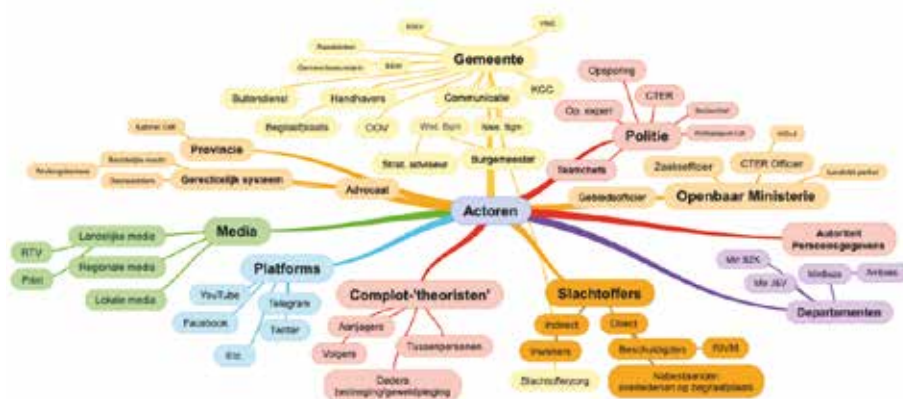
Figuur 1 Sociale kaart van complottheorie en de bij de aanpak daarvan betrokken partijen