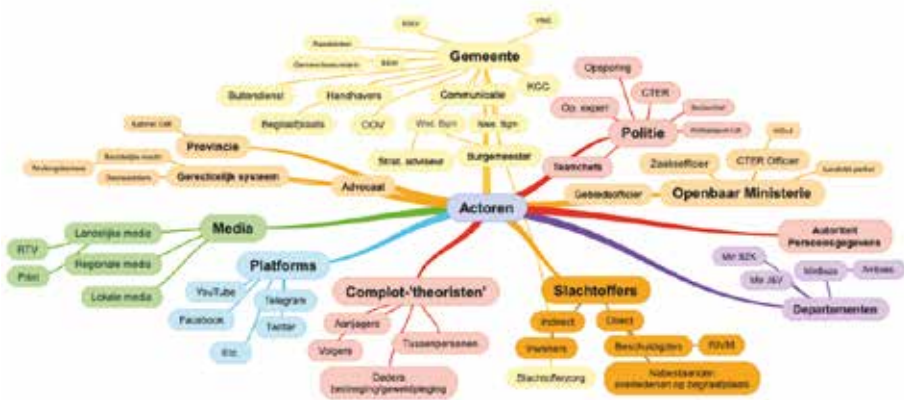
Figuur 1 Sociale kaart van complottheorie en de bij de aanpak daarvan betrokken partijen

In de derde fase van het onderzoek werden semigestructureerde interviews gevoerd met 22 personen die nauw betrokken zijn geweest bij de ontwikkeling en uitvoering van de aanpak. Functionarissen aldus van gemeente, politie en Openbaar Ministerie, op zowel bestuurlijk, beleidsmakend, als uitvoerend niveau. Met verschillende van deze personen is meerdere malen gesproken. Een (geanonimiseerd) overzicht van de gesprekspartners is opgenomen als bijlage B.