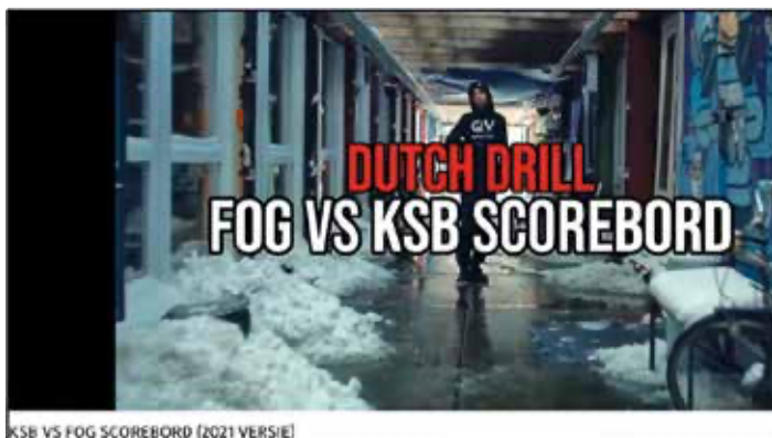
Afbeelding 3.1 Voorbeeld van een scoreboard

Afbeelding 3.1 geeft het beginbeeld weer van een YouTube-video van 29 april 2021 waarin de scores van KSB en FOG (drillrapgroepen uit Amsterdam) op een rij worden gezet. In deze video komen de volgende teksten voor: ‘VL steekt Y.RS. Punten: 1’ en ‘RS gekilled door Wouter 22. Punten: 3’.