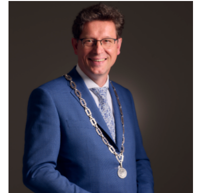
Roger de Groot burgemeester Noordoostpolder