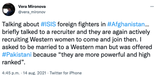
Afbeelding 2. en 3. Enkele voorbeelden van ISKP-rekrutering gericht op mogelijke uitreizigers. Deze screenshots komen van een geanonimiseerd account van Vera Mironova, een gerenommeerde academica, beleidsonderzoeker en journalist die onderzoek doet naar gewelddadige conflicten. [111]