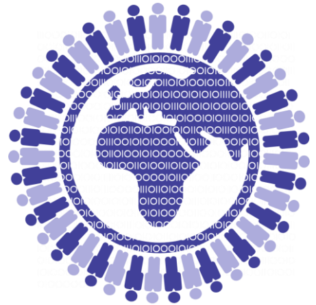
Bescherming van saamhorigheid tussen gebruikers